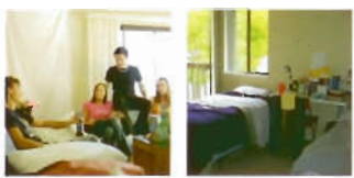
Student residence example Twin room example

密集、主要、暑期及考試： 2010-2011 每週一 (請參閱第62頁) 學年制外語留學/專業英語課程 2010-2011：(請參閱第18頁)