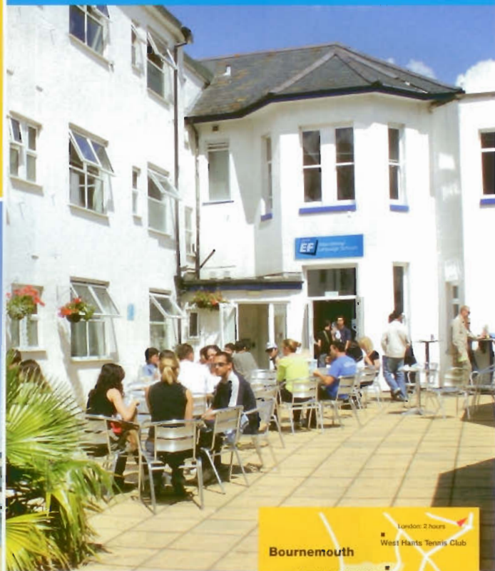
寬敞的花園中庭是您下課後放鬆心情，和三五好友小聚的最佳場所。